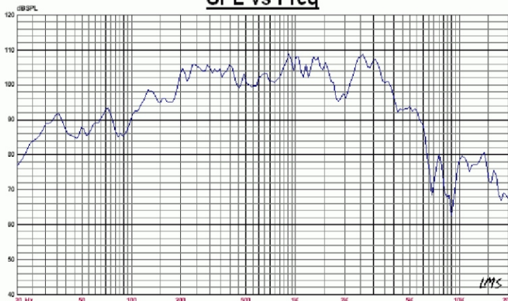
SPL vs Freq